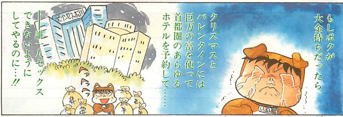
▲よくフラレねーよな この犬